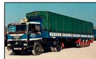
EL CUATRO PATAS. Éste es el segundo Pegaso que tuvo mi padre y aparece él en la foto. Por aquel entonces yo tenía 6 ó 7 años.