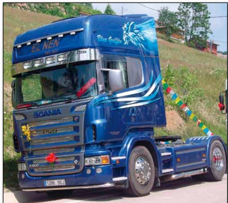
EN CAMPRODÓN. Celebrando la festividad de San Cristóbal.

la que está cayendo. En no pocas ocasiones, el transportista debe hacer valer una especie de instinto camaleónico para transformarse y cambiar las reglas del juego en la medida en que sea posible para seguir formando parte del colectivo de la carretera, de la gran familia del camión. Y no siempre resulta tarea sencilla para un hombre que viene de un pequeño pueblo flanqueado por los ríos Muga y Manol, muy próximo a Figueres, que apenas supera