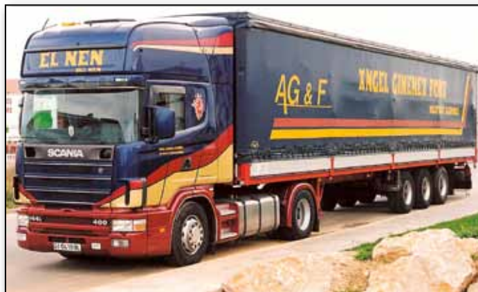
DOS MARCAS. Pegaso y Scania han formado parte de la historia en la carretera de nuestro anfitrión.