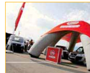
▲ FIAT. El concesionario Garatges Sala de Figueres llevó una representación de la gama de esta marca italiana.