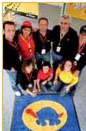
▲ RED TORTUGA. La Escuela de Conducción Vial fue un éxito total, así como las peticiones para hacerse con la exclusiva tarjeta Transcard.