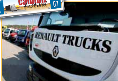
▲ EN MARCHA. Renault Trucks aprovechó el evento de La Jonquera para poner en marcha su ruta formada por ocho vehículos de su gama ligera.