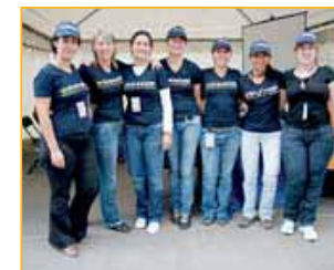
▲ WTRANSNET. El equipo de esta compañía de bolsa de cargas online posa al completo ante el stand que la empresa tuvo en el SCF.