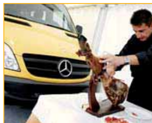
Los asistentes al stand de Mercedes no sólo disfrutaron del Sprinter, también pudieron deleitarse con un poco de jamón.