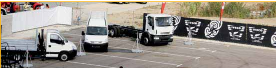
▲ IVECO. Además de los Stralis All Blacks, el fabricante italiano asistió al SCF con un Eurocargo y dos Daily.

y un Dyna, una completa gama de comerciales con los que la marca ha entrado en nuestro país. Además, el fabricante nipón sorteó 10 neveras durante el fin de semana.