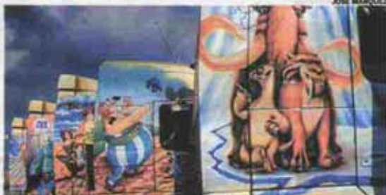
ARTE. EL festival reunió muchas cabezas tractoras personalizadas.

Decenas de transportistas tuvieron la oportunidad de demostrar sus habilidades en el manejo de una tractora con re-